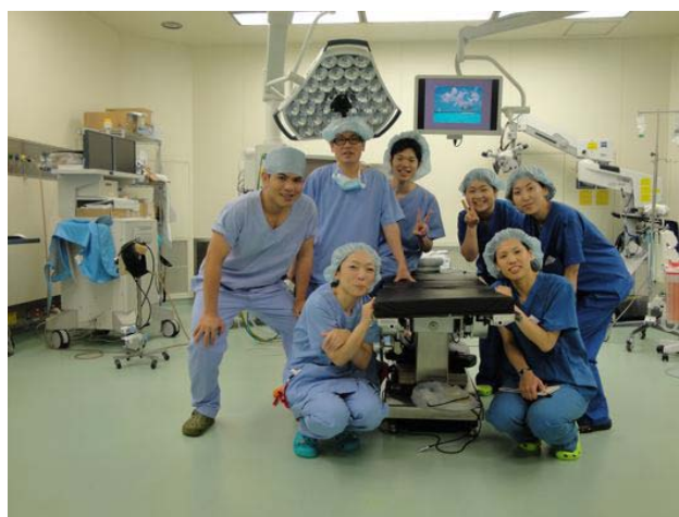
術場スタッフと一緒に