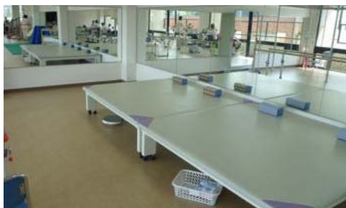
自主トレ用プラットホーム