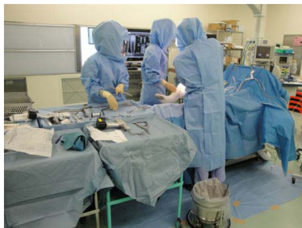
手術室（人工関節手術中）