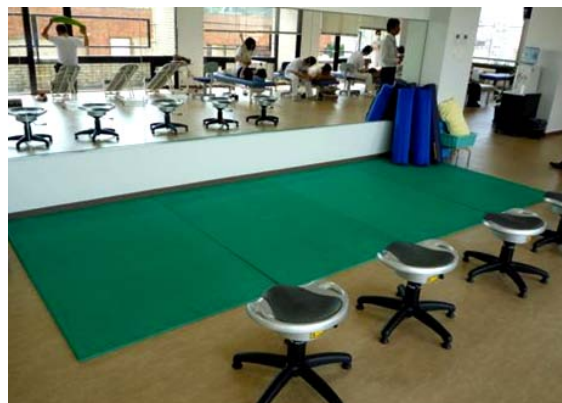
セルフコンディショニングエリア